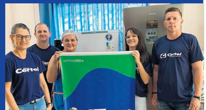
Cruzeiro do Sul