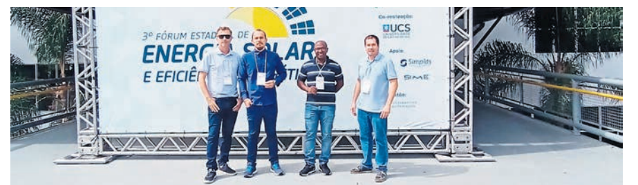
Áreas de engenharia, técnica e de faturamento da Certel

Entre os dias 04 a 05 de abril, a Certel esteve presente no 3º Fórum de Energia Solar e Eficiência Energética, no Parque de Eventos da Festa da Uva, em Caxias do Sul.