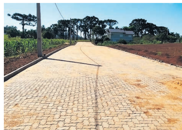
Loteamento localizado em São Pedro da Serra

Dou nota dez pela dedicação e auxílio prestado na escolha dos produtos.”