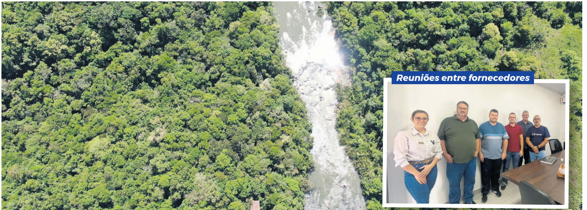
Hidrelétrica estará localizada entre os municípios de Pouso Novo e Coqueiro Baixo

Encontros realizados com empresas asseguram o andamento das obras