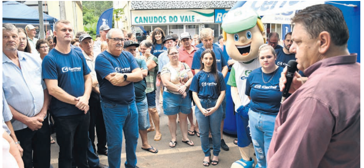
Ponto de atendimento conta com todos os negócios da Cooperativa

C om o objetivo de manter-se cada vez mais integrada com seu quadro social, foi inaugurado, no dia 24 de março, o quinto Ponto de Atendimento da Certel. Localizado na Rua João José Briesch, 376, no Centro de Canudos do Vale (em frente à rodoviária), o mesmo tem o objetivo de estreitar os laços entre a Cooperativa e seus associados/clientes. O local conta com a representação de todos os serviços, como loja de eletrodomésticos, encomenda de pré-moldados, postes, pisos intertravados e demais artefatos de cimento, geração, distribuição e comercialização de energia elétrica.