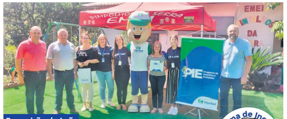
Boqueirão do Leão