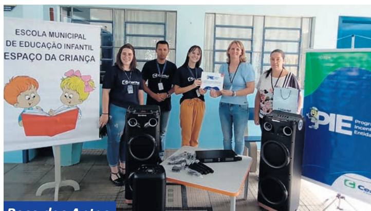
Poço das Antas

As evoluções proporcionadas ao ramo educacional pelo Programa de Incentivo a Entidades (PIE) da Certel são nítidas e têm beneficiado escolas de diversos municípios. Por meio de parte das suas sobras (lucro), a Cooperativa vem auxiliando muitos educandários a qualificarem suas estruturas e, por consequência, alcançarem avanços em aprendizagem.