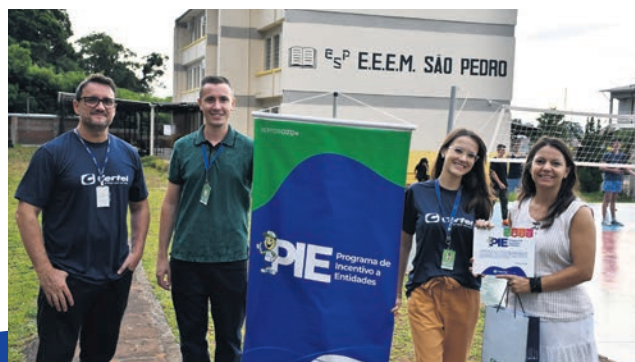
São Pedro da Serra