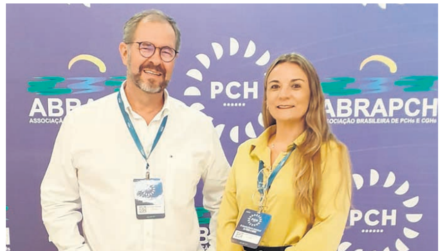
Feira de negócios evidenciou a geração e comercialização de energia

A 6ª Conferência Nacional de PCHs e CGHs ocorreu nos dias 29 e 30 março, em Brasília, Distrito Federal. Focando na geração e comercialização de energia elétrica, o evento contou com empreendedores, autoridades do governo e especialistas na área. Composto por sessões que abordam aspectos regulatórios, socioambientais, econômicos e políticos da implantação e operação de usinas, tem como objetivo fomentar o debate técnico e comercial no setor de pequenas centrais geradoras hidrelétricas.