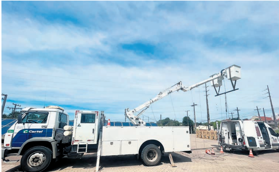
Sinais conseguem detectar possíveis falhas nos equipamentos

Processo permite ensaios que realizam um monitoramento acústico a uma carga controlada