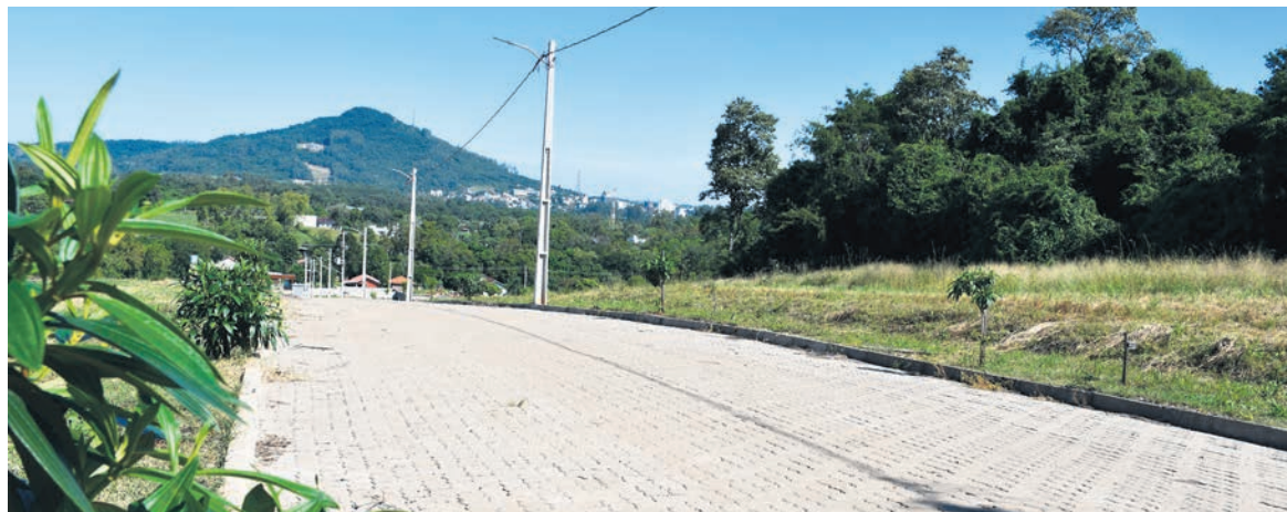
Condomínio Brune contará com todas as soluções da indústria de artefatos

Novo condomínio e pavimentação de ruas contam com materiais da Cooperativa