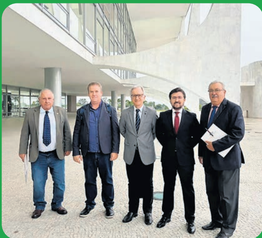
Pauta tratou assuntos prioritários para as Cooperativas

Federações e Infracoop foram recebidas em audiência no Palácio do Planalto, em Brasília, pelo ministro-chefe Paulo Roberto Severo Pimenta, da Secretaria de Comunicação Social. Apresentou-se, principalmente, um importante pleito, a estruturação de programas de redes trifá-