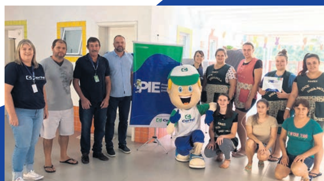
Canudos do Vale