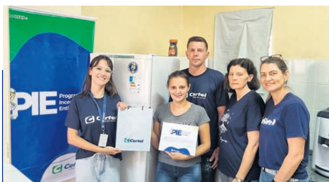
Cruzeiro do Sul