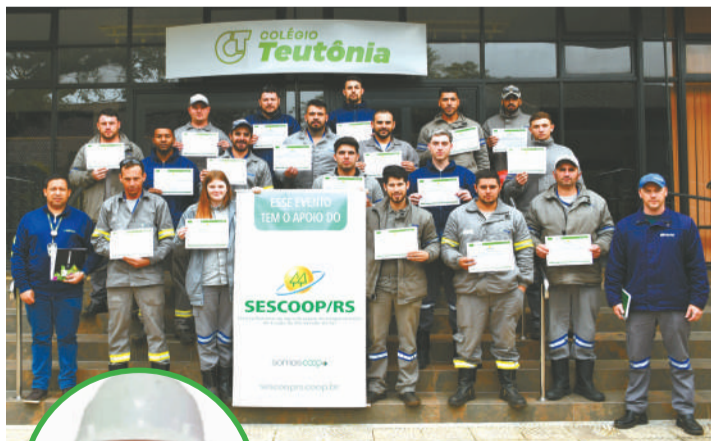
Curso foi realizado no Centro de Treinamentos do Colégio Teutônia