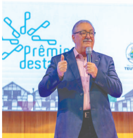
Certel conquistou oito troféus