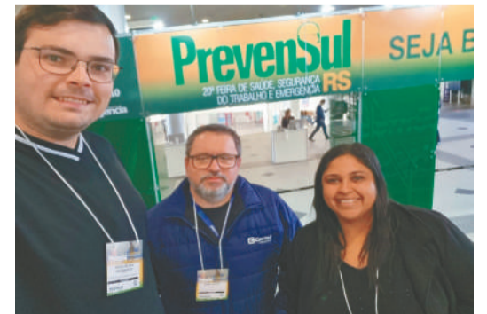
Profissionais de segurança do trabalho da Certel participaram do evento

contribuições significativas para o desenvolvimento das atividades em todas as áreas de atuação da Cooperativa. “Por ser um evento que reúne especialistas de várias regiões e Estados, possibilitou a troca de conhecimento sobre as melhores práticas e inovações no setor, permitindo a atualização, capacitação e o networking com profissionais e empresas da área. Identificamos ideias e estratégias para melhorar as condições de trabalho e saúde dos colegas, alinhadas com as boas práticas já desenvolvidas pela Certel, e contribuindo para a construção e o fortalecimento de uma cultura de segurança cada vez maior e mais sólida”, afirmaram.