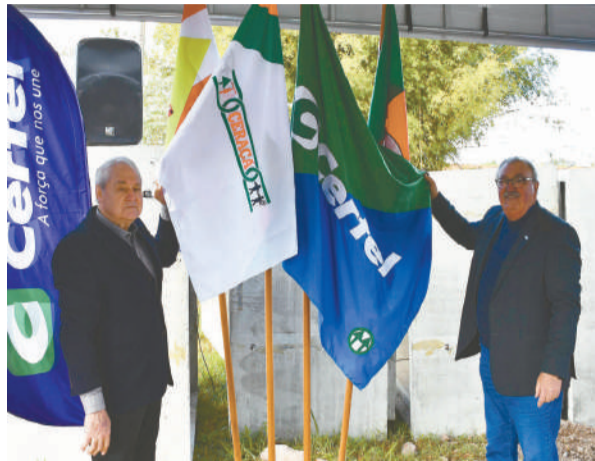
Thiesen (e) e Hennemann com as bandeiras de suas cooperativas e estados

Depois de a Certel ter sido auxiliada por muitas Cooperativas gaúchas e catarinenses, em razão da tragédia climática que atingiu a região e grande parte do Estado, agora, mais um gesto de solidariedade do Cooperativismo de infraestrutura de Santa Catarina se consolida por meio da intercooperação. A Cooperativa Ceraçá, de Saudades, no oeste catarinense, no intuito de também ajudar na recuperação da área de atuação que foi severamente prejudicada pela enchente histórica de maio, doou à Certel galerias de concreto, que poderão ser utilizadas na recuperação da infraestrutura de nove municípios. Serão beneficiados Pouso Novo (6 galerias), Marques de Souza (6), Travesseiro (4), Progresso (4), Boqueirão do Leão (4), Canudos do Vale (4), Poço das Antas (4), Sérico (4) e Imigrante (4).