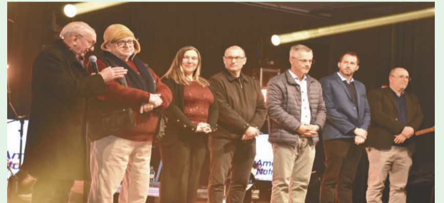
Festival revelou talentos