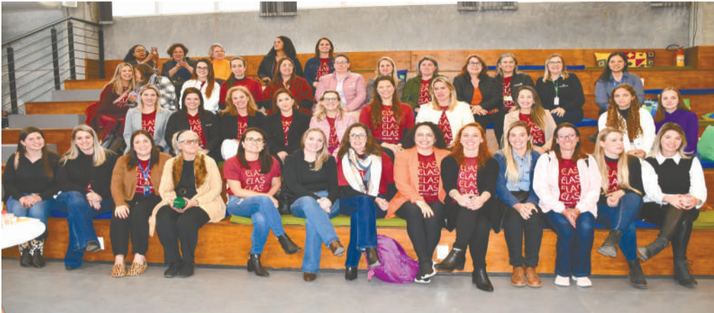
Comitê Elas pelo Coop realizou encontro