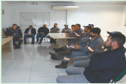
Certel tem três equipes de linha viva

Equipes de linha viva são essenciais nas atividades desenvolvidas pela Certel, uma vez que, é a partir do auxílio delas que o associado não é impactado com desligamentos. Nesses casos, os profissionais trabalham diretamente em contato com a rede