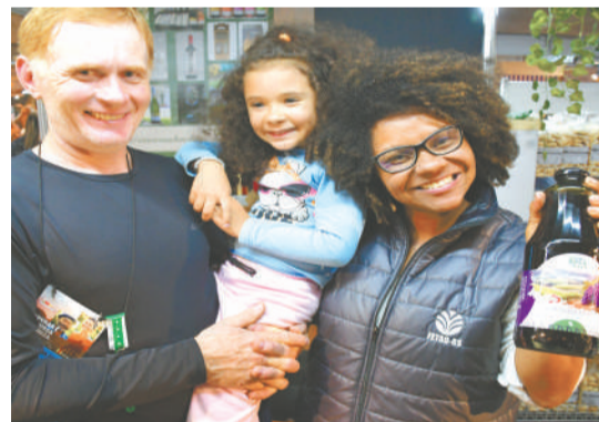
Sítio Rosa do Vale