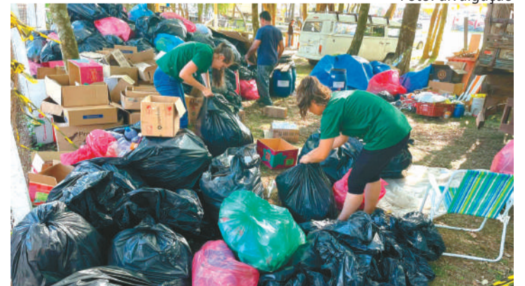
O evento ocorre de 07 a 10 e de 13 a 17 de novembro, no Parque do Imigrante, em Lajeado