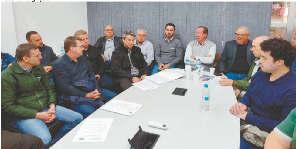
Foram tratados vários temas que afetam o trabalho das filiadas

A FECOERGS realizou reunião com as Cooperativas de infraestrutura no dia 28 de setembro, na sede da OCERGS, junto à Expointer, em Esteio. O objetivo foi avaliar e atualizar os serviços prestados aos associados, além de mensurar os encaminhamentos necessários para facilitar o dia a dia das filiadas.