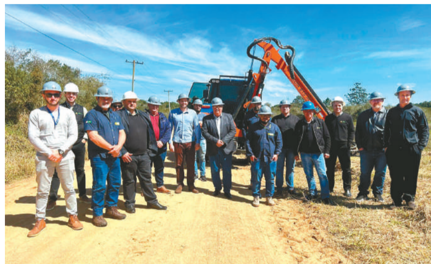
Direção conheceu os benefícios do trator com roçadeira para podas