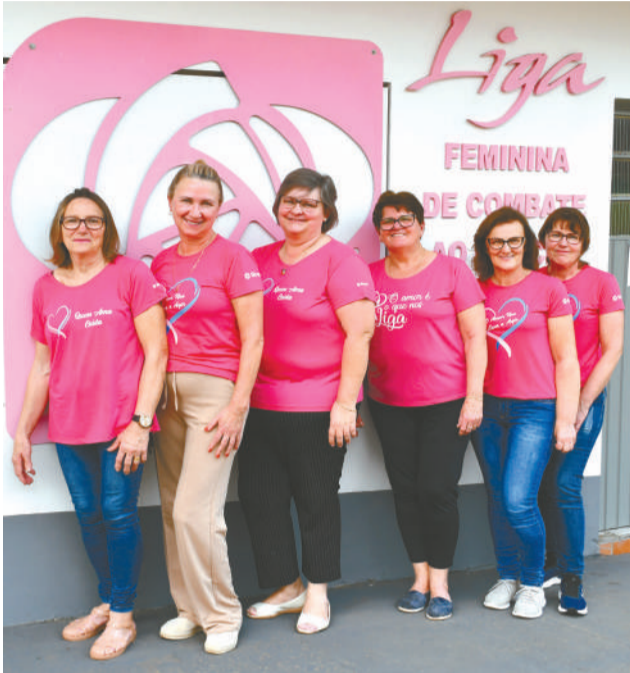
Voluntárias em frente à sede, no Bairro Teutônia

Há 15 anos, a Liga Feminina de Combate ao Câncer de Teutônia presta importante auxílio no tratamento à enfermidade. Em torno de 900 pessoas já foram beneficiadas e, além de Teutônia, são contemplados também moradores de Westfália, Poço das Antas, Imigrante, Paverama e Fazenda Vilanova. Entre os pacientes, 51% são mulheres e 49% homens.